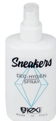
Formato: 200ml Format: 200ml

HOW TO USE: Spray inside the shoe and leave to dry well.