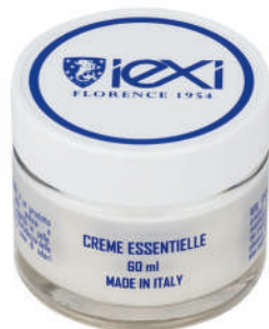
Formato: 60ml Format: 60ml

Creme Essentielle pulisce con delicatezza diverse superfici in pelle. Rimuove con facilità lo sporco, restituendo un aspetto fresco e pulito ai tuoi articoli. MODO D'USO: Applicare con panno e strofinare bene per ottenere l'effetto desiderato – Quindi ripassare con altro panno soffice ed asciutto per togliere ogni residuo. Non utilizzare su pelli scamosciate e nabuk.