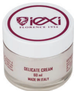
Formato: 60ml Format: 60ml

Delicate Cream è un gel speciale per detergere delicatamente ed esaltare le qualità di oggetti pregiati in pelli. MODO D'USO: applicare con panno, poi strofinare bene, sino ad ottenere l'effetto desiderato – Quindi ripassare con altro panno soffice ed asciutto per togliendo ogni residuo. Non utilizzare su pelli scamosciate e nabuk.