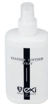
Formato: 200ml Format: 200ml

HOW TO USE: Spray the product in the necessary place of the shoe worn or in shape. Walk for a few minutes, repeat the operation if necessary