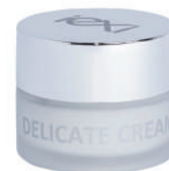
Formato: 50ml Format: 50ml

Delicate Cream is a special gel to clean delicately and enhancing the qualities of precious leather objects. HOW TO USE: Apply with a cloth, then rub well until the desired effect is obtained – Then with another soft, dry cloth, clean again, removing any residue. Do not apply on suede and nubuck.