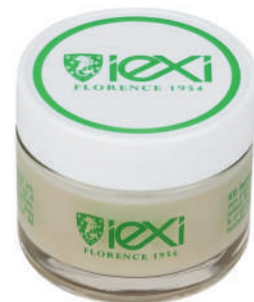
Formato: 60ml Format: 60ml

HOW TO USE: Apply a small amount of cream to the desired surface and distribute it evenly with a cloth. Leave to dry and polish with a soft cloth to obtain a beautiful shiny effect. The cream absorbs quickly and leaves no oily residue. Do not apply on suede and nubuck.