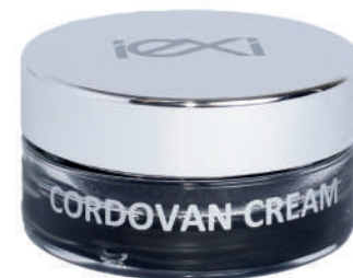
Formato: 50ml Format: 50ml

HOW TO USE: Apply with a sponge or cloth, after a short time, polish with a soft cloth.