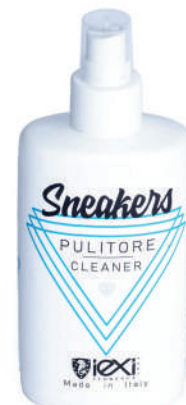
Formato: 200ml Format: 200ml

HOW TO USE: Spray the product directly on the surface to be treated or on the sponge and/or cloth. Rub well.